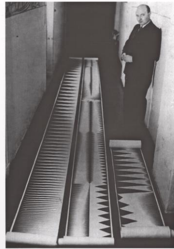
Oskar Fischinger mit Ornamentalen für synthetischen Tonvorgang, 1932

Klangmuster, die das Individuelle einer menschlichen Stimme ausmachen). 7 Allein die Möglichkeit, dass Stimmen ertönen können ohne die Voraussetzung der ontologischen Verbindung zu menschlichen Körpern ihrer Äußerungen, sollte deutlich machen, dass Stimmen (auf der Tonspur) grundsätzlich mit den Bildern der Körper, die sie zu äußern scheinen, erst im Produktionsverfahren von Filmen gekoppelt werden, wo sie auch wieder entkoppelt und neu montiert werden können. Ihre Synchronisation ist ein filmisches Basisverfahren.