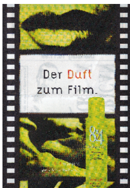
[Abb.7: Werbung für ein Deodorant]

Zum amerikanischen Kino seit den fünfziger Jahren gehört untrennbar der durchdringende Popcorn-Geruch oder wie Vladimir Nabokov in seinem Roman Lolita Humbert Humbert