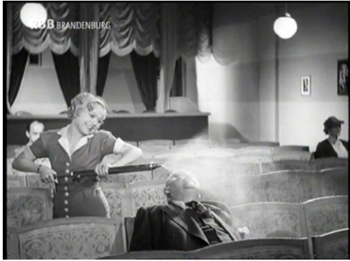
[Abb.5.: Filmstill aus MEINE FREUNDIN BARBARA (Fritz Kirchhoff, D 1937) mit Grete Weiser als Platzanweiserin]

Die Luft war gegen Ende eines Films dick ‚zum Zerschneiden‘. Vor lauter Rauschwaden konnte man kaum noch den Film sehen. Und selbstverständlich wurde im Publikum geredet, zum Glück schwieg der Film, so dass keine goldenen Worte von der Leinwand im Lärm der Zuschauer untergingen.