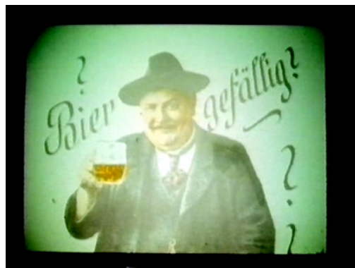
[Abb. 1,2: Kino-Reklame-Dias, „Orchesterpause“ und „Bier gefällig“]

Wenn das Bier ausgetrunken war, hing der Bierdunst noch lange in der Luft. Und wenn es draußen geregnet hatte und die Kleider der Menschen nass waren, vermischte sich der Alkohol in der Luft mit den üblichen Körperausdünstungen und dem besonderen ‚Odeur‘ feuchter Kleidung. All dies ließ einen Kinobesuch zum olfaktorischen Abenteuer werden. Ventilatoren oder eine Klimaanlage gab es noch nicht. Dafür liefen Bedienstete des Kinos in regelmäßigen Abständen mit einer sogenannten Flittspritze durch den Saal und versprühten Desinfektionsmittel zur ‚Luftveredelung‘. Berüchtigt waren die OZONAL -Luftreinigungs-Apparate, die lt. Inserat im Kinosaal „in 30 Sekunden [die] von Krankheitserregern durchsetzte Luft blitzschnell in einen gesunden, frischen, nach Ozon duftenden