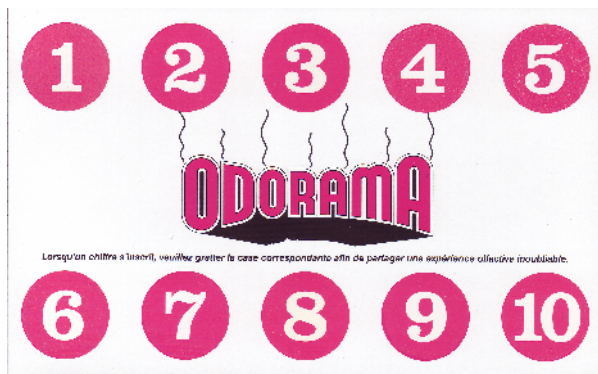
[Abb.6: Polyester Rubbelkarte]

Publikum kann mitriechen: Rosenduft, Spitalatmosphäre, Autogestank und endlich Weihrauch während der Hochzeit des Paares in einer gotischen Kapelle"(Aeppli 1981, 333). Die Story ist hier offenkundig nur ein Vorwand, um die verschiedensten Düfte und Gerüche verströmen zu lassen. Das sogenannte Odorated Talking Picture - Verfahren, kurz O.T.P. , wurde nach jahrelangen Versuchen von Hans E. Laube erfunden, der bei dem Film auch die ‚Duftregie‘ geführt hat. Es soll ihm gelungen sein, 4000 verschiedene Gerüche zu simulieren, die über die von ihm entwickelten O.T.P. -Apparaturen vollautomatisch reproduzierbar waren. Ein individuelles Verfahren war, Kratz- und Riechkarten ans Publikum auszuteilen, die mit verschiedenen für den Film benötigten Gerüchen imprägnieren waren, und die dann an markierten Stellen im Film von den Zuschauern durch Rubbeln unter der Nase freigesetzt werden konnten... Dieses Odorama - Verfahren wurde für den John Waters Film POLYESTER (1981) verwendet und wurde sogar für die DVD-Edition beibehalten.