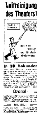
[Abb. 3,4: Inserate aus der Fachzeitschrift Der Kinematograph , 1912]